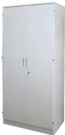
ЛАБ-PRO ШМП 90.50.193